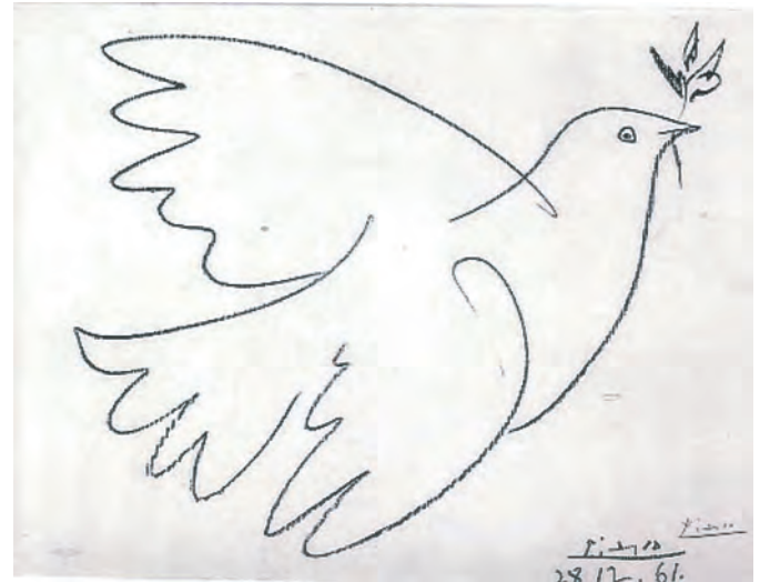
Pablo Picasso: Taube mit Olivenzweig, 28. Dezember 1961, Courtesy Saint-Denis, Musée d'art et d'histoire und Irène Andréani

Auch diese Darstellungen Picassos waren nicht jedermanns Geschmack. Jedoch, Picasso und vielen anderen Künstlern war es ein Bedürfnis auf schreckliche und gewaltsame Ereignisse zu reagieren. Picasso kreierte auch die weiße Friedenstaube, die weltweit zum Symbol des Friedens wurde. Diese seiner Werke hängen in staatlichen Museen und sind praktisch unverkäuflich. Auch wenn diese Bilder nicht unbedingt das Auge des Betrachters erfreuen - ob sie Käufer finden wird sich zeigen - von Bedeutung sind sie allemal. Wer sonst könnte uns die Realität besser vor Augen führen wenn nicht die intellektuelle Künstlergarde. Ob solche künstlerischen Appelle helfen werden die Welt zu verbessern? „Die Hoffnung stirbt zuletzt.“