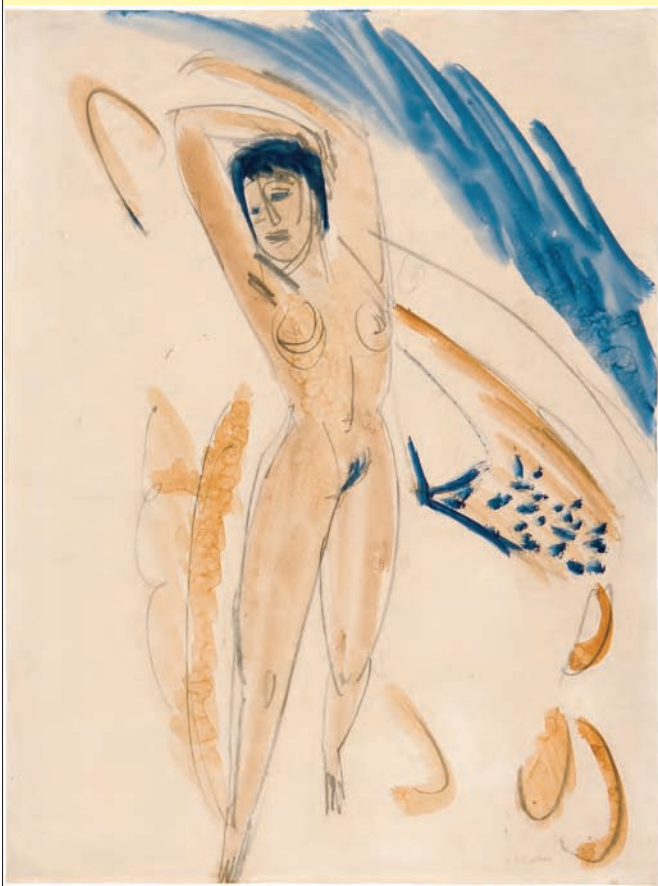
Der Kunsthandel Wienerroither & Kohlbacher bietet ein Aquarell über Vorzeichnung in Bleistift - „Sich reckender Akt“ - von Ernst Ludwig Kirchner, um 1913-14 entstanden, an. chl